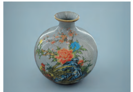
美術工芸品等の保存