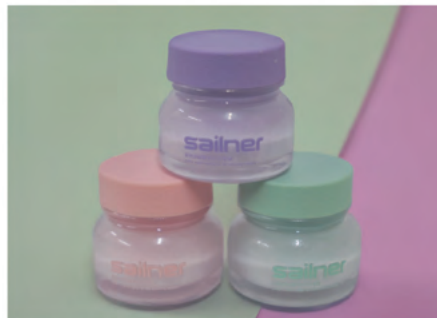
製品プロトタイプ