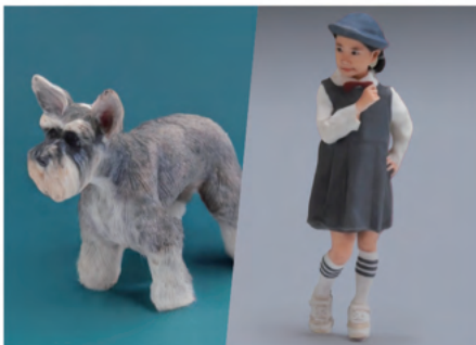
高精細フィギュア