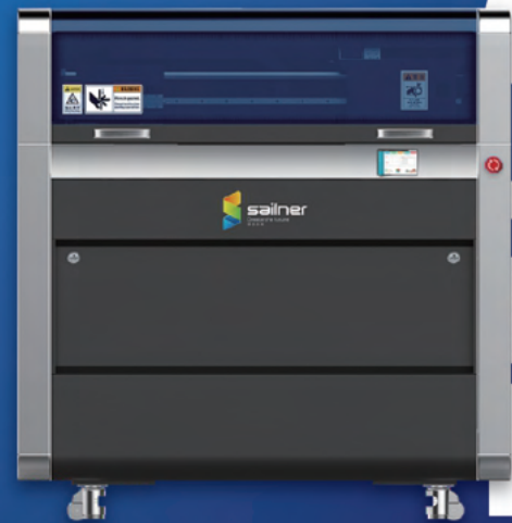
WJPフルカラー3Dプリンター