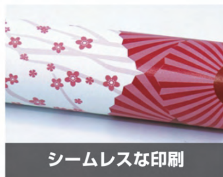
シームレスな印刷