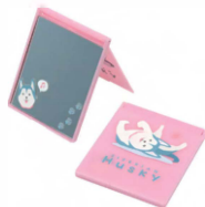
コンパクトミラー